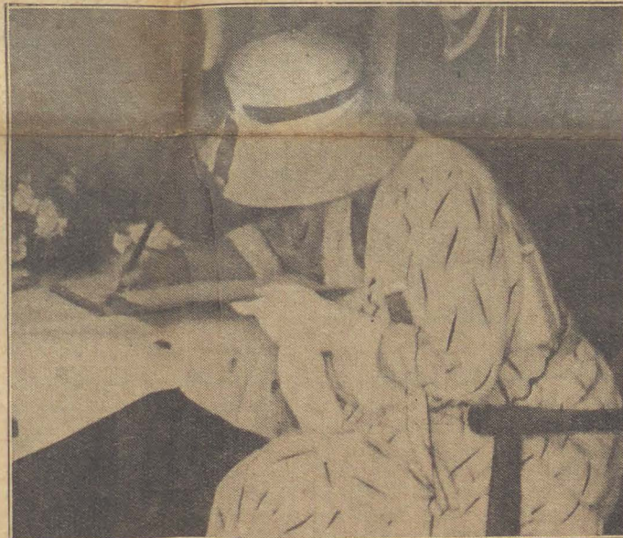
Rechts beneden: De drukte voor het Kinderhuis.